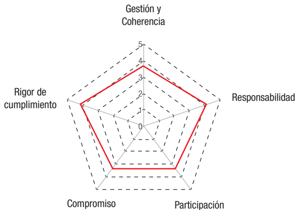
Gráfico 1. Indicadores de Gestión de la Seguridad 1

1.- Chequear el diseño existente del Sistema de Gestión de la Seguridad, cuantificando indicadores de los aspectos fuertes y débiles de dicha Gestión.